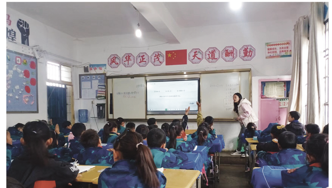
往届数学与应用数学专业基层特岗教师